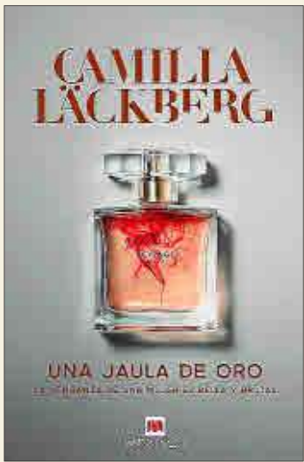
Camilla Läckberg Una jaula de oro MAEVA, Madrid, 2019